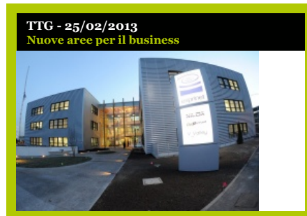
TTG - 25/02/2013 Nuove aree per il business

Servizi cloud e nuove iniziative per promuovere l'innovazione a supporto del business delle Piccole e medie imprese italiane.